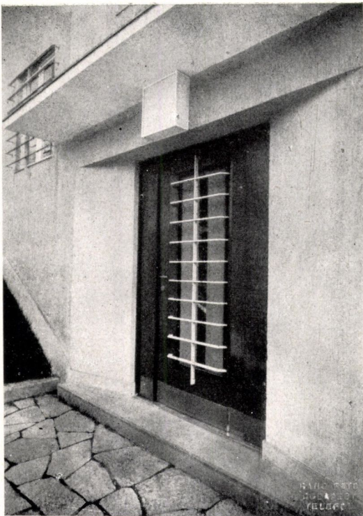
A Marcibányi-téri bérvilla részletei