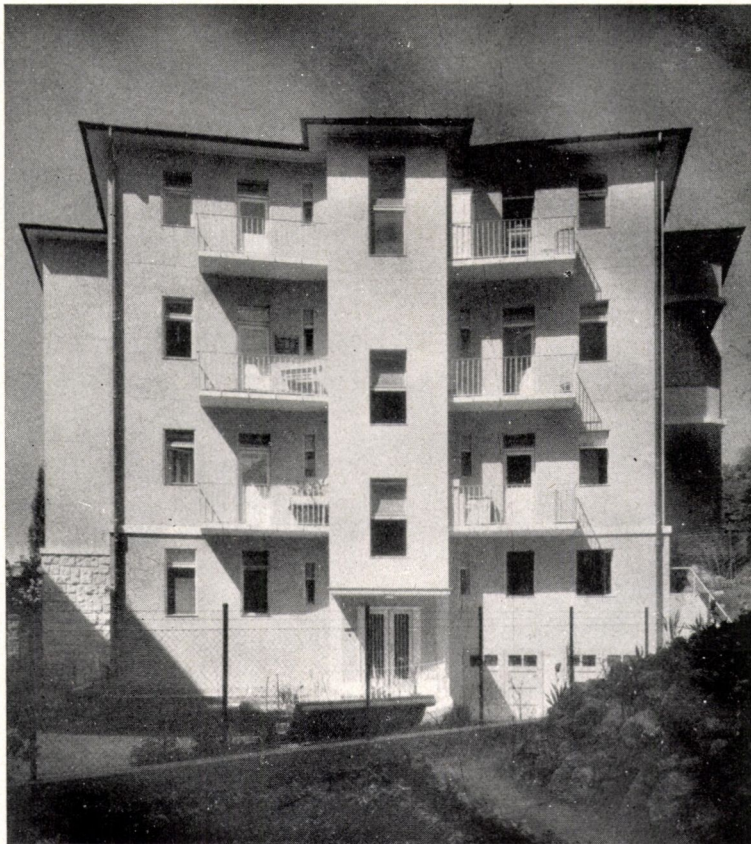
A Nagybaldogasszony-úti bérvilla udvari homlokzata. Tervezte: Münnich Aladár

— sajnos — valóban igen sok épületünkön ott díszelgnek. Erre csak azt válaszolhatnánk, hogy mindig voltak álmodernekek, középszerűk, akik nem eszmék, hanem divatok után indultak s nem a feladat lényegét tartották szemük előtt; más magyarázat, mint a divat ezen jelenség elterjedtségére nincs: hiszen sem nem szép, sem nem célszerű, semminemű értelme nincsen, lényegi tradícióunktunkhoz nem fűzi, legfeljebb a historikus építészet esökevényeként magyarázható.