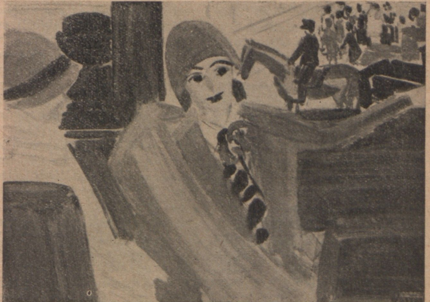
Vaszary János: Autóbuszban