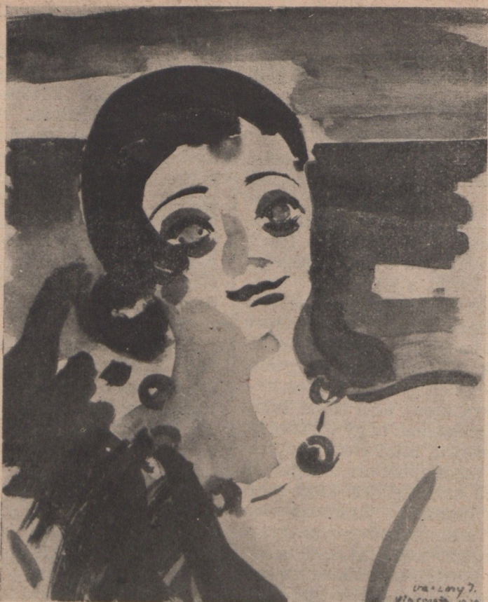
Vaszary János: Olasz hölgy

ányzik, holott éppen a nívó emelése terén ez fontos hivatást töltené be. Éppen mert nálunk a kellő szociális érzék híján a magángazdasági érdekek nehezen képesek szélesebbkörű összefogásra. Így a lakóházépítés energiái továbbra is csak ilyen anarchikus formában tudnak érvényrejutni. S ahogy a gazdasági helyzet romlik, a tőkék csökkenésével ez a széttagoltság, s vele az építési anarchia még fokozódik.