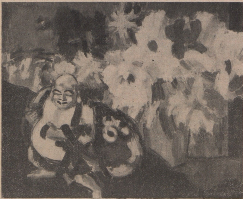
Vaszary János: Virágszendélet

— Dehogyan kérem, vászonra... mondta. B. ó.