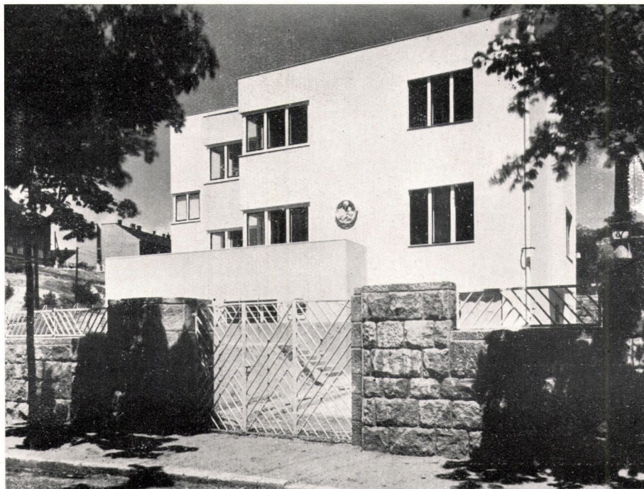
Dr. Lechner Jenő: Bérvilla bejárata és alaprajzai

Ha ezeket a számokat látjuk, akkor érthető az az ellenszenv, amellyel a főváros vezetősége a külterjes fejlődést szemléli! Azonban szabadjon ezt a kérdést egyszer más oldalról is megvilágítani, a megszokott álláspont ellenkező oldalára is reámutatni. Itt van mindezekelőtt az a tény, hogy míg Budapest lakossága az elmúlt két évtizedben csak 11.3%-kal emelkedett, az u. n. statisztikai Nagy-Budapest lakosságának száma 29%-kal lett magasabb! A Nagy-Budapest fogalom alatt kezelt 22 községben a népszaporulat 90%-os volt! Ezek egy része az ország egyéb részeiről költözött ide, másik része a fővárosból vonult oda ki. Tette ezt egyrészt azért, mert úgy tapasztalta, hogy ott olcsóbb a megélhetés, másrészt pedig az e tanulmányban tárgyalt okoknál