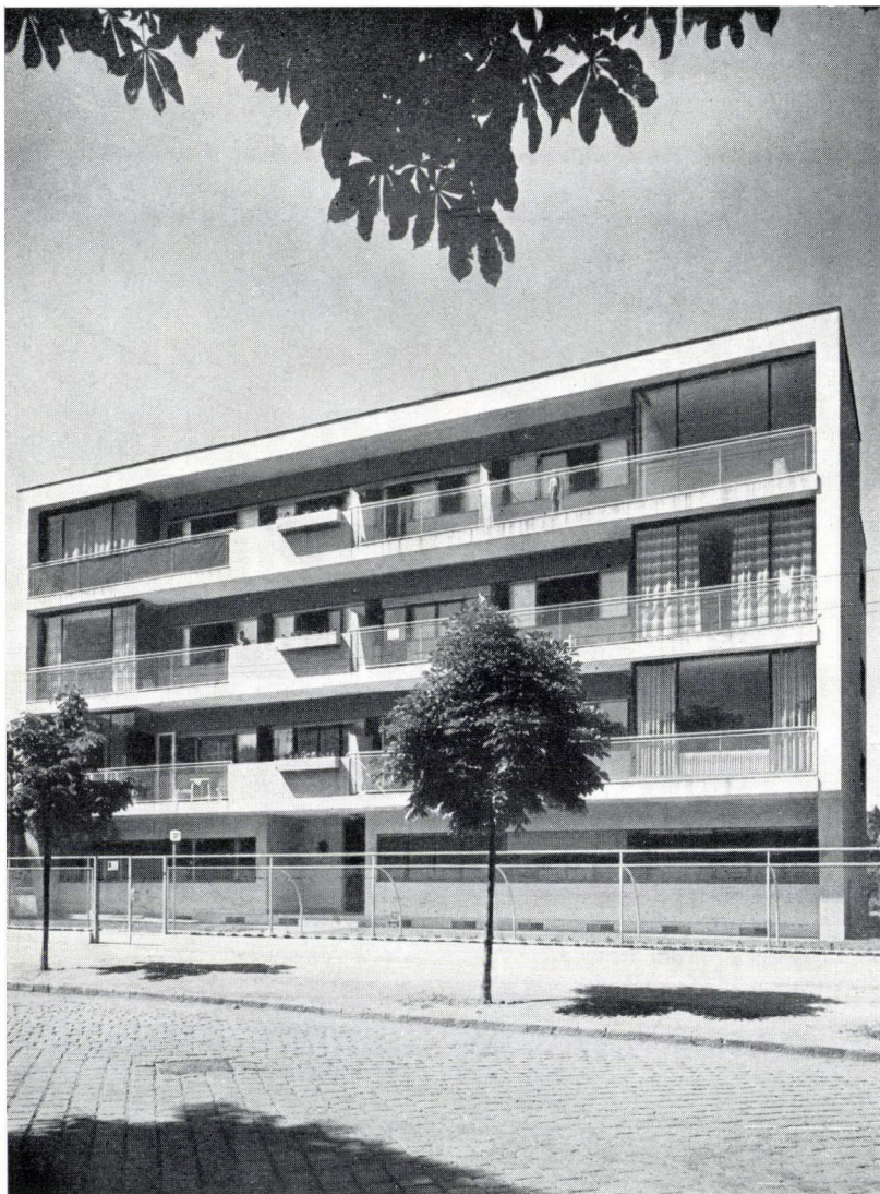
Társasvilla Budapesten az Olasz-fasorban — Tervezte: Wanner János — Kivitelezte: Wanner Henrik — Acélablakok és redőnyök: Korányi és Fröhlich — Tolóablakok: Kozmaport-rendszerűek — Mehrfamilienhaus im Villenviertel von Budapest — Entwurf: Johann Wanner — Villa containig appartements to lei — Arch.: J. Wanner