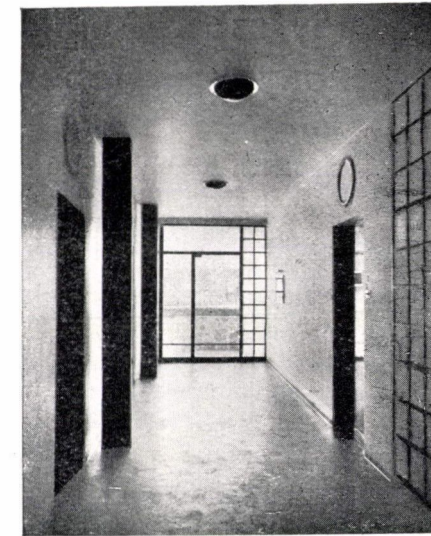
Bérház Budapesten az Ilona-utcában. A vakolat Űstököscementtel készült.